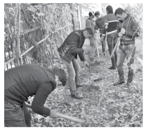
თსუ საზოგადოებასთან ურთიერთობის დეპარტამენტი

26 ნოემბერს ივანე ჯავახიშვილის სახელობის თბილისის სახელმწიფო უნივერსიტეტის მე-VII კორპუსის ეზოში ქართულ ენაში მომზადების პროგრამის სტუდენტების მონაწილეობით „მეგობრობის ხეივანი“ გაშენდა. ლონისძიების ფარგლებში აზერბაიჯანულენოვანმა და სომხურენოვანმა სტუდენტებმა პედაგოგებთან ერთად მარადმწვანე ჯიშის 40 ნერგი დარგეს. სტუდენტები მთელი წლის განმავლობაში იზრუნებენ ხეებზე და სხვადასხვა საინტერესო შეხვედრას გამართავენ.